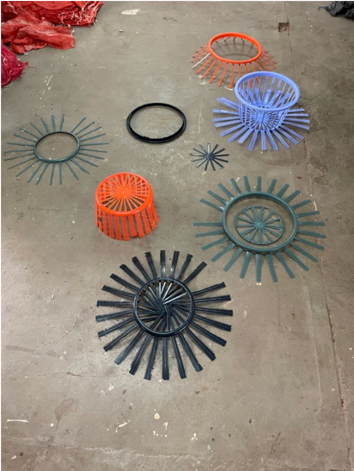
Expanding suns (work in progress). Photo: Sofie Amalie Andersen, 2023.