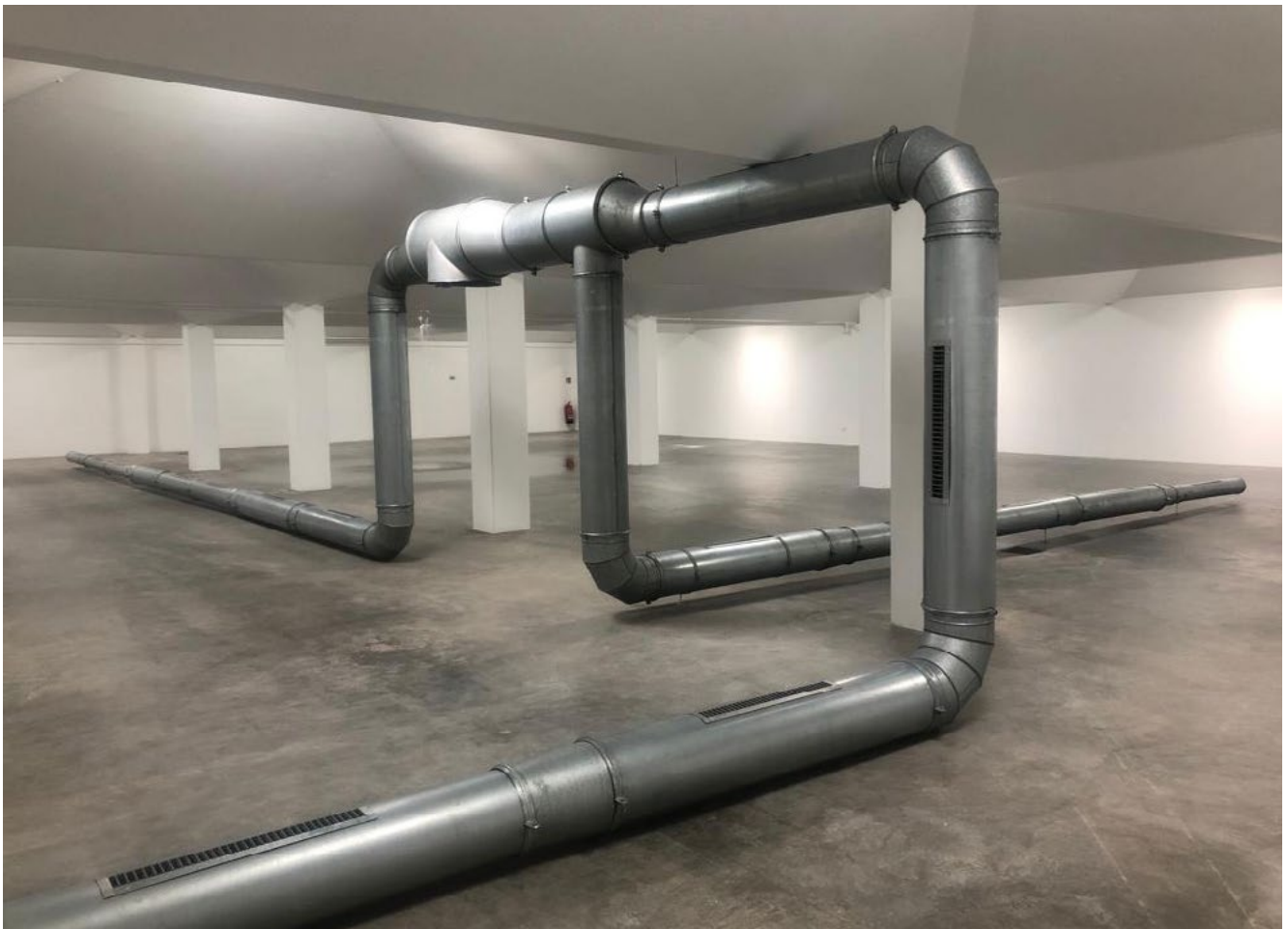
An installation of Violets 2 by Ghislaine Leungs at Simian, Copenhagen.