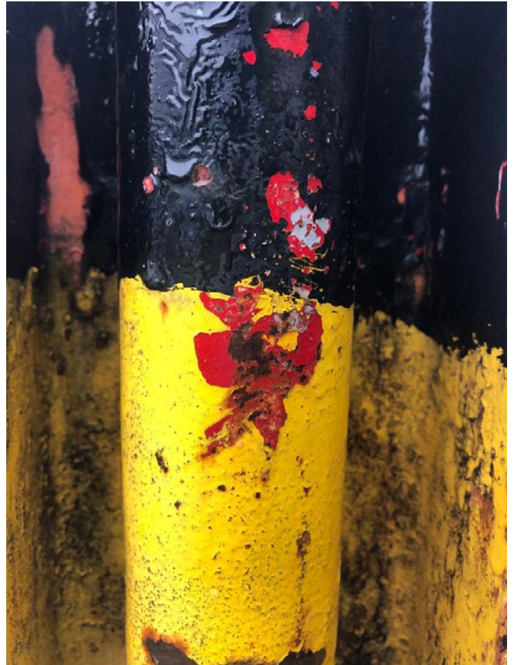
Grey spots. Photo: Abdul-Salam Alhassan, 2023.